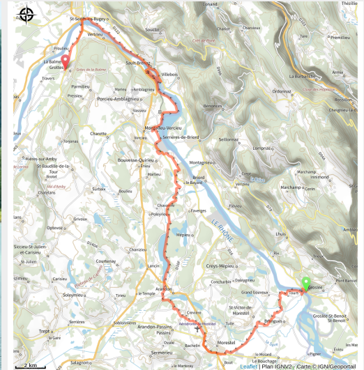
ViaRhôna vue du ciel près de Seyssel

ViaRhôna, de Groslée à La Balme-les-Grottes. Cette étape de ViaRhôna chemine à travers une nature préservée au bord du Rhône et dans les terres du Nord Isère.