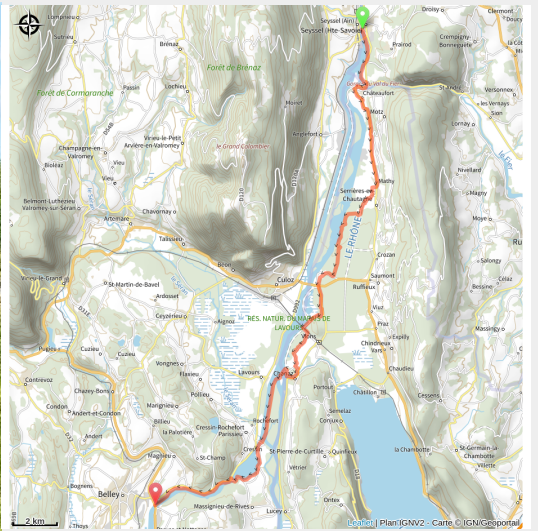
Viarhônga à Chanaz, canal de Savières

ViaRhônga, de Seyssel à Belley par Chanaz. Cette étape de ViaRhônga emprunte les deux rives du Rhône. Le parcours vélo provisoire, entre crêtes et plateaux, joue avec des paysages ponctués de cascades et de lacs.