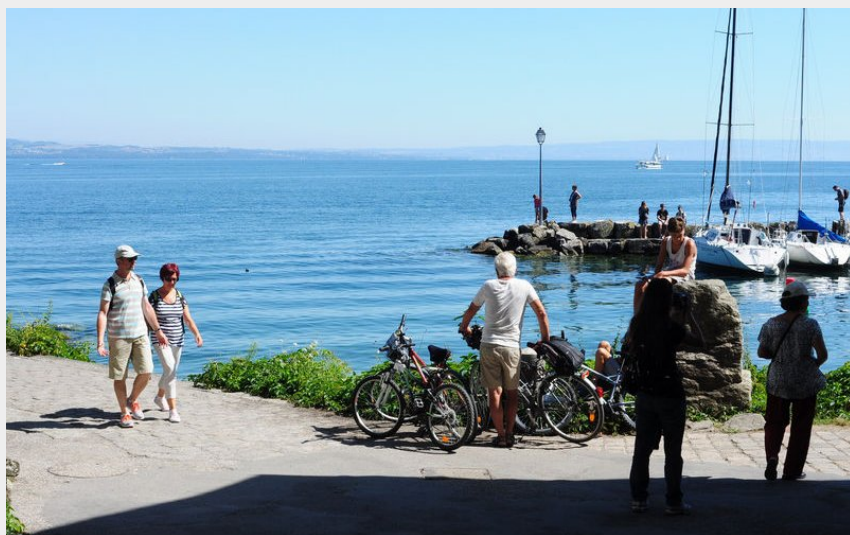
Cyclistes à Yvoire