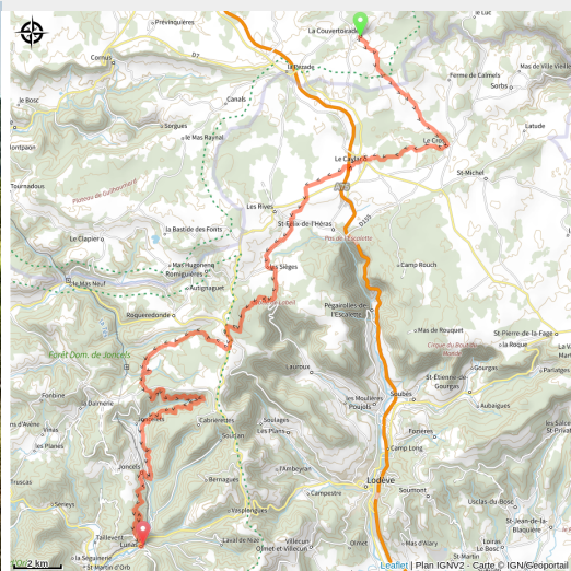
Sur la GTMC-VTT