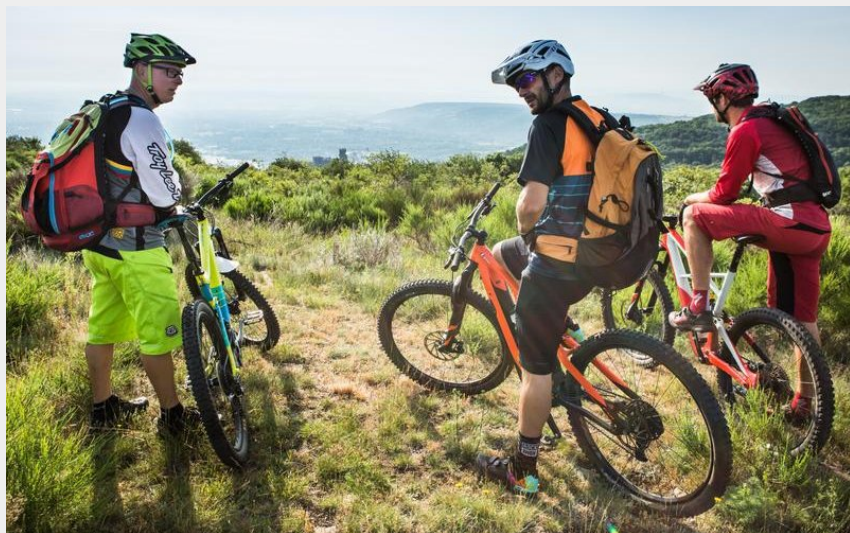
Sur la GTMC-VTT