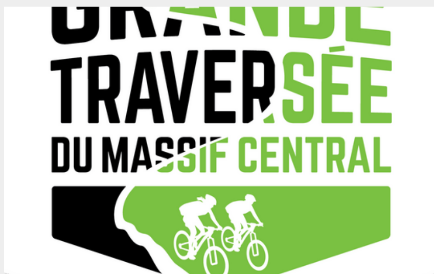
Logo GTMC-VTT (GTMC-VTT)