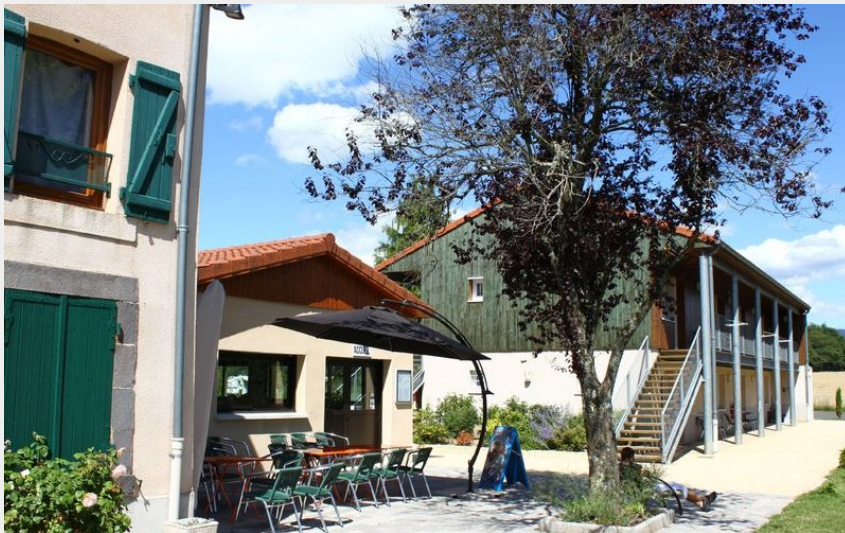
Gîte des 4 Vents (Gîte des 4 Vents)