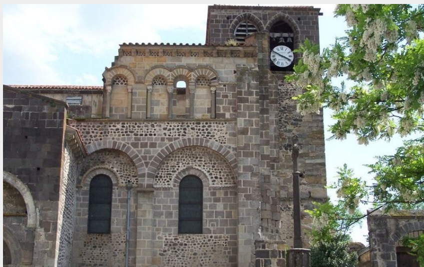
Abbaye de Mozac (Office de Tourisme Riom Limagne et Volcans)