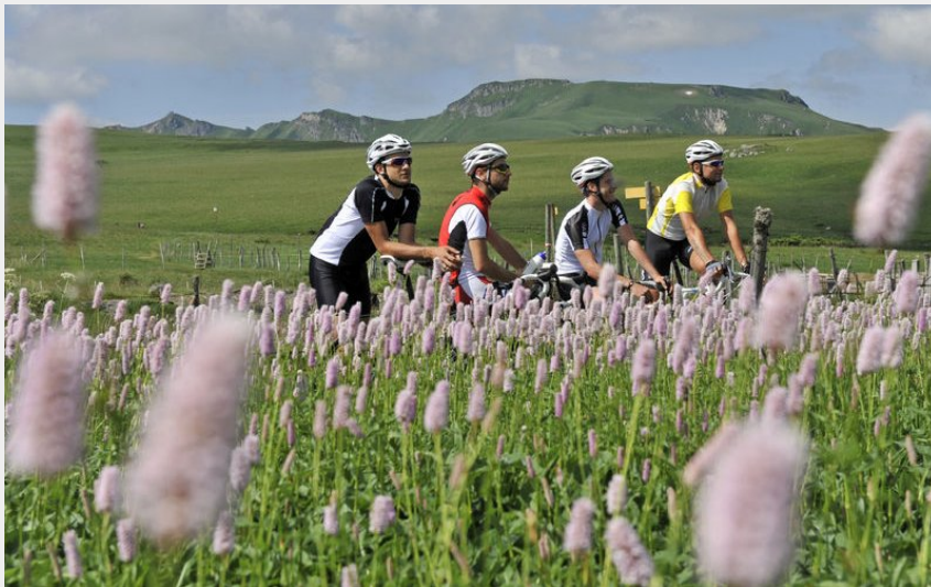
Sancy vélo (Joël Damase)