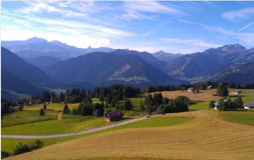
Le hameau des Pémonts (OT des Saisies)