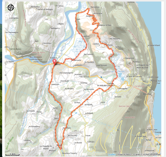
Circuit du Vignoble (Philippe Beluze SMAPS)