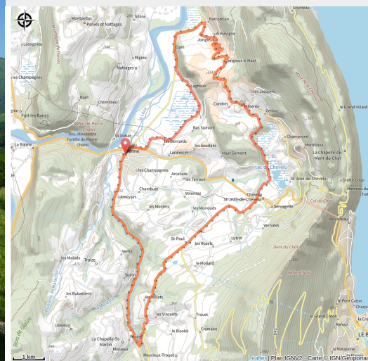
Circuit du Vignoble (Philippe Beluze SMAPS)