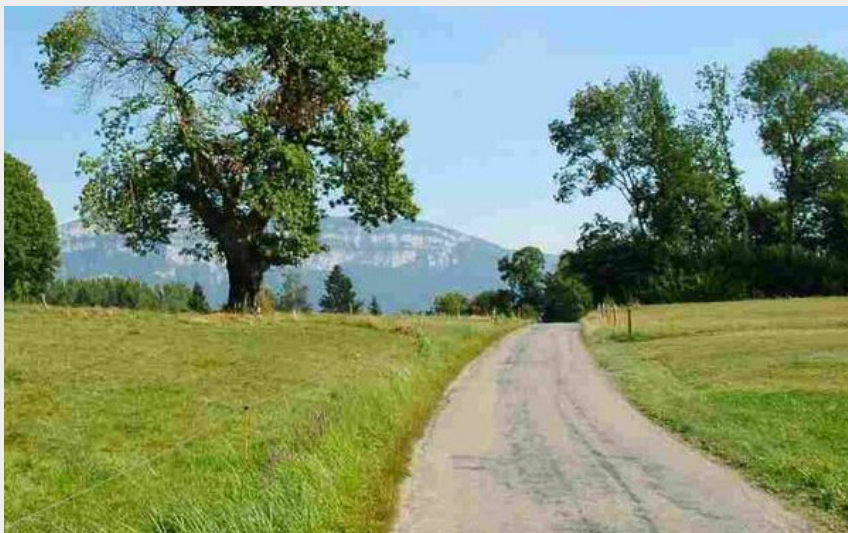
De la Crusille vers le lac d'Aiguebelette (OT Lac d'Aiguebelette)