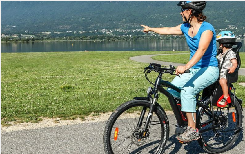
Bord du Lac du Bourget (D Gourbin - Chambéry métropole)