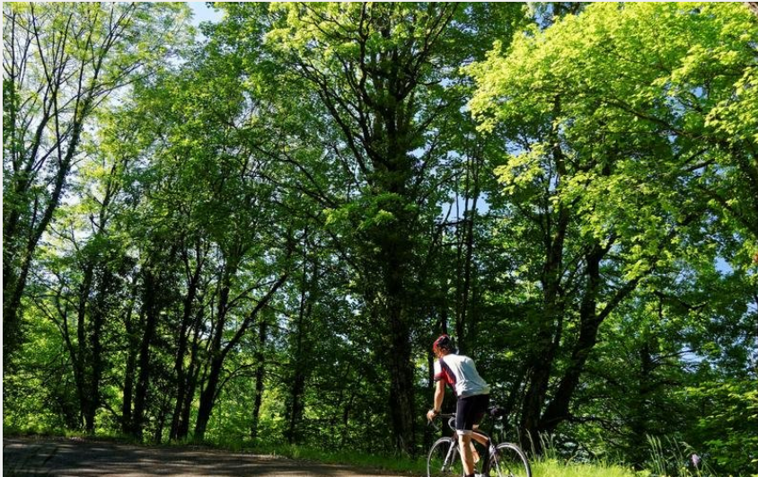
(Savoie Mont Blanc - Anglade)