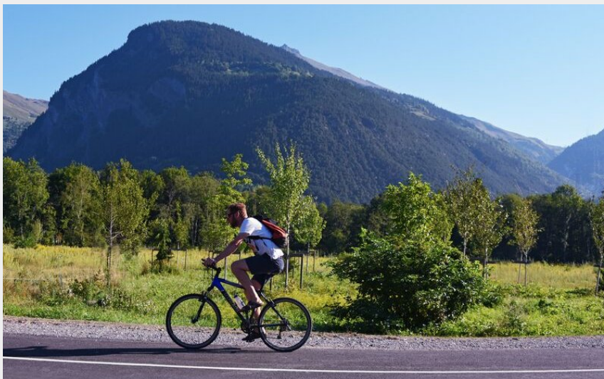
Piste Cyclable