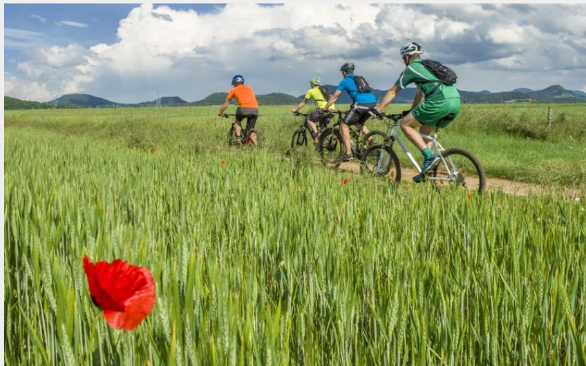
Conquérir les chemins de la nature (Luc Olivier)