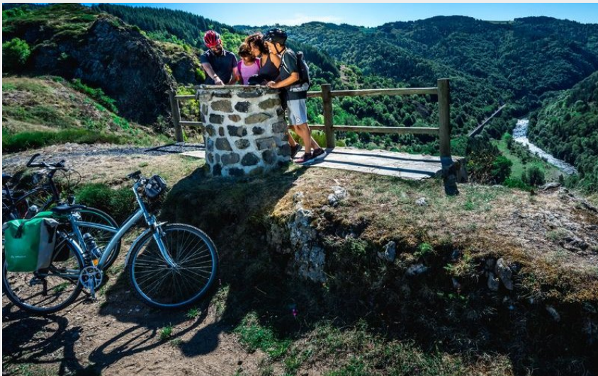
Table d'orientation près d'Alleyras