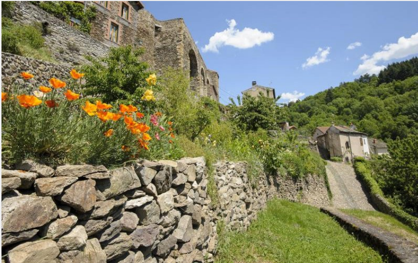
Le village médiéval d'Auzon, classé "Petite cité de caractère" (Papou Poustache)