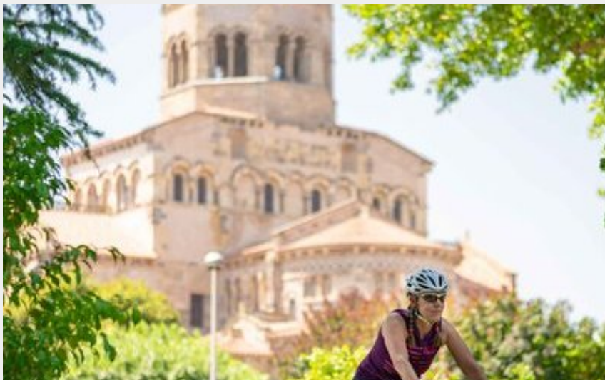
L'Abbatiale Saint-Austremoine d'Issoire