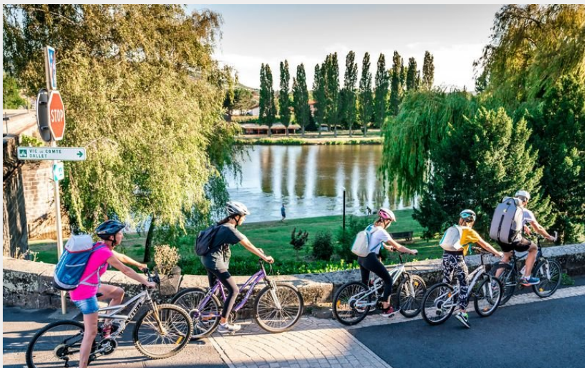
Bords d'Allier à Pont-du-Château