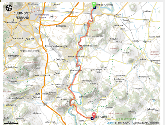
Bords d'Allier à Pont-du-Château