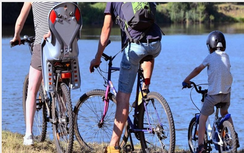
Balade en famille (Jean-Claude PARAYRE)