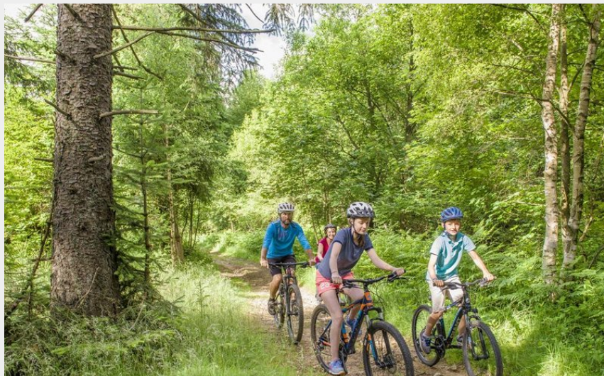
La famille trace son chemin dans les bois (Luc Olivier)