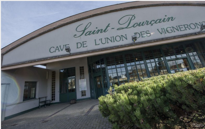
La cave des vignerons de Saint-Pourçain