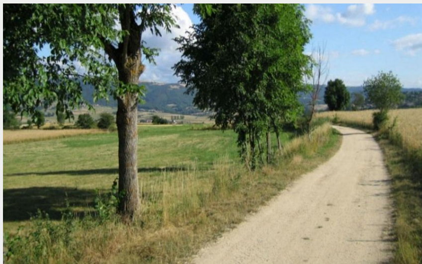
Sur les chemins de Haute-Loire (Jean-Claude PARAYRE)