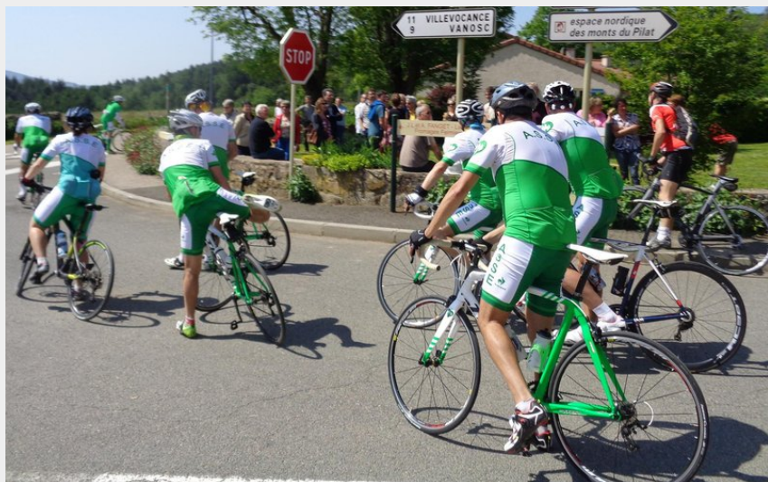
Cyclos à Burdignes (P Arnaud)