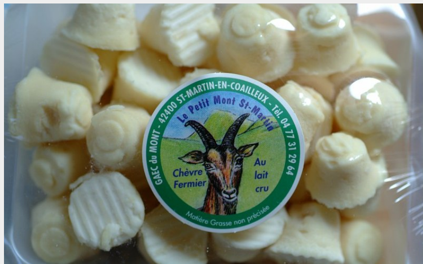
Rigotte de Condrieu