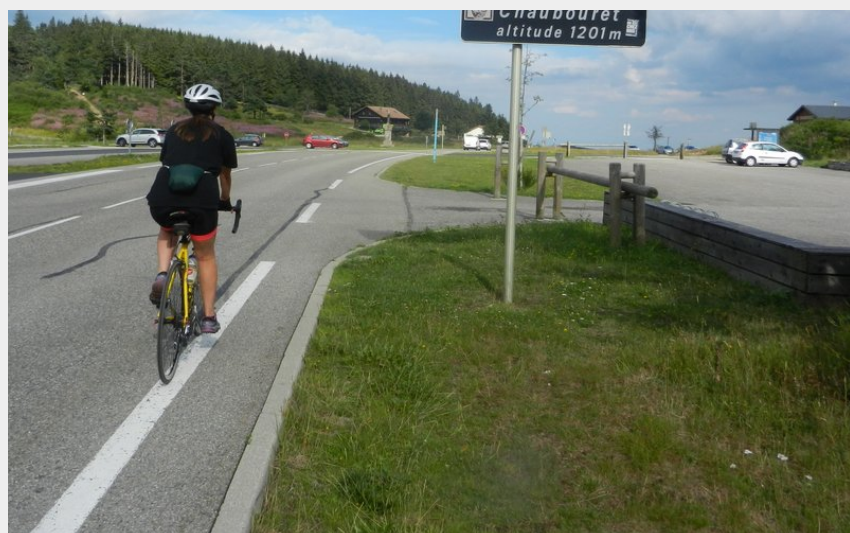
Col de la Croix de Chaubouret (P Arnaud)