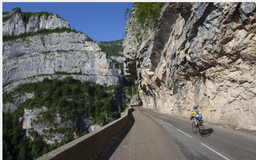
Vélo dans les gorges (S&M Booth)