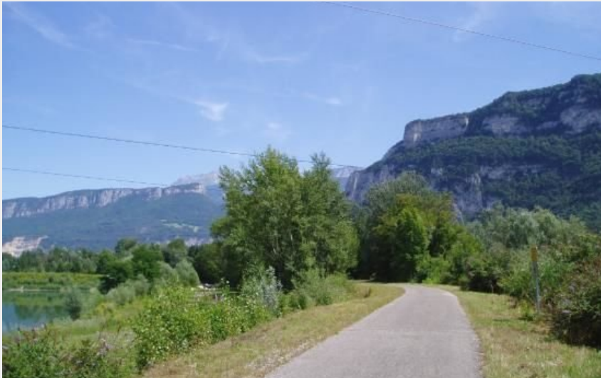
Paysages de la Belle Via (J.Savary)