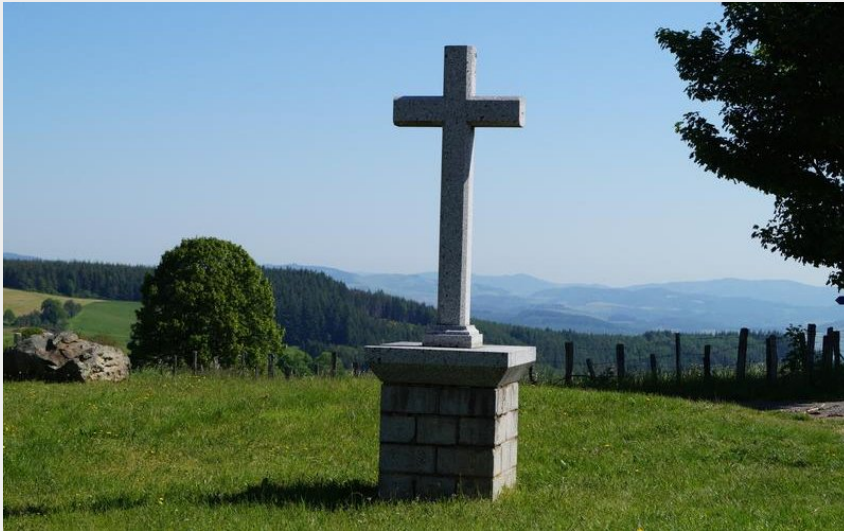
Croix Casard (OT Forez Est)