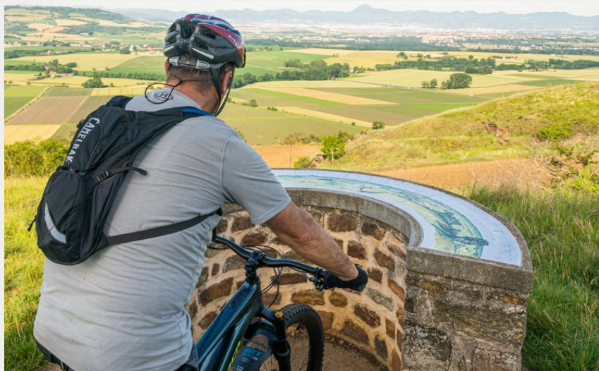
Point de vue depuis la tour de Courcourt