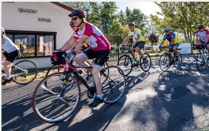
(Centre les 4 Vents)