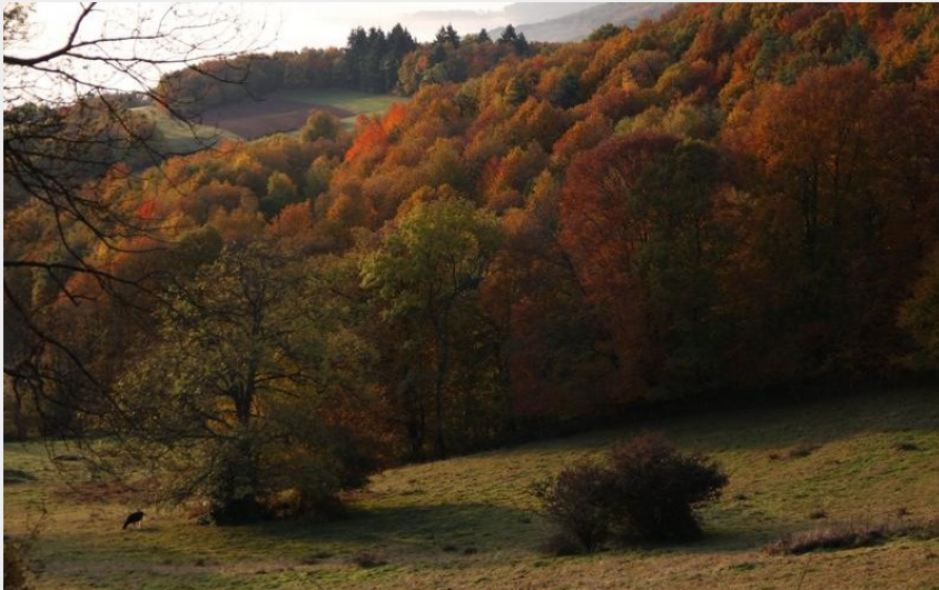
Circuit VTT 63 - Les Crets Boisés_Saint-Pierre-la-Palud (Nicolas de Cocquerel)