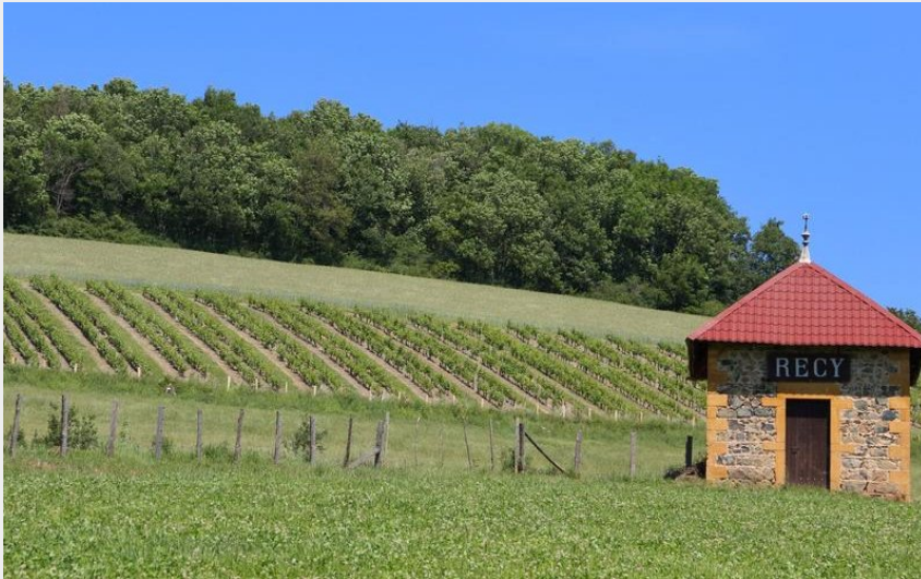
Circuit VTT 75 - Le Cret du Recy_Savigny (Nicolas de Cocquerel)