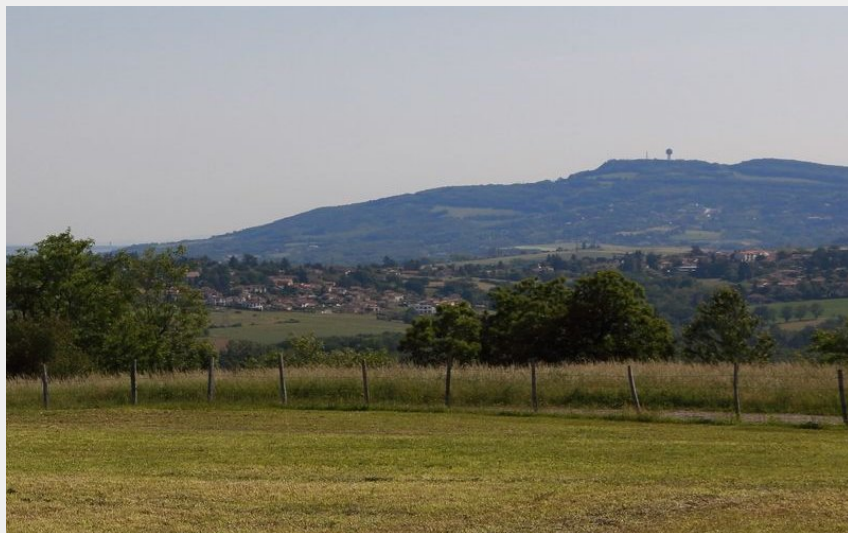
(Nicolas de Cocquerel)