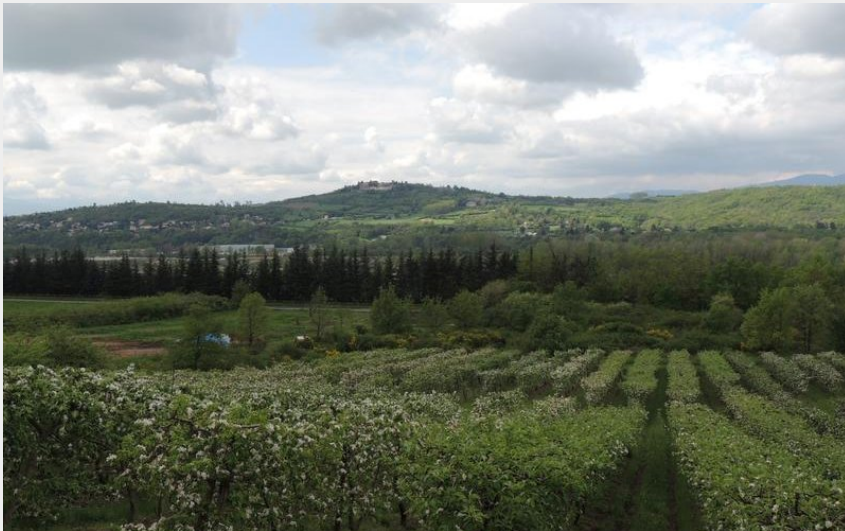
Vue sur Montagny depuis Millery (Office de tourisme des Monts du Lyonnais)