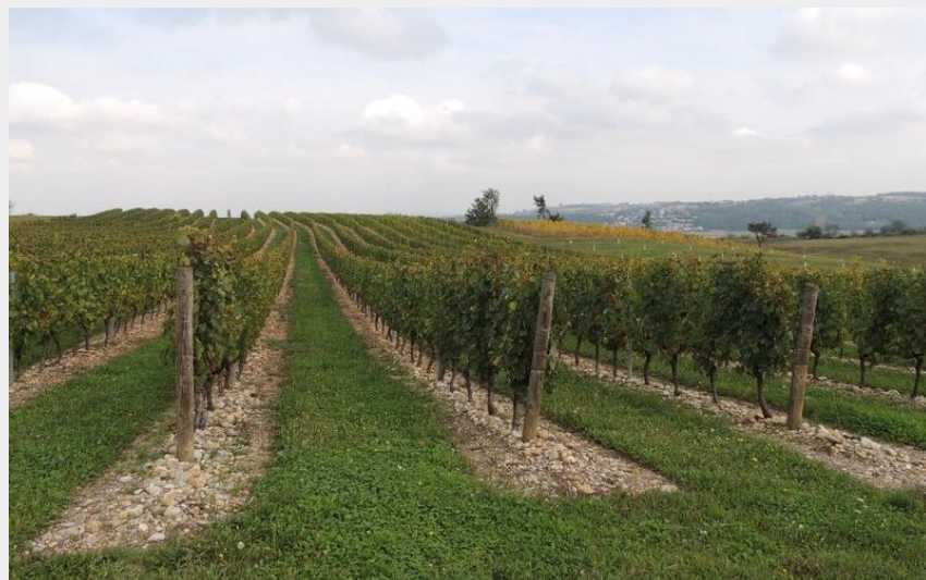
Vignes des Coteaux du Lyonnais (Office de tourisme des Monts du Lyonnais)