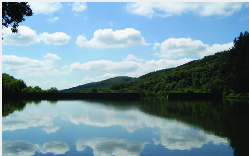
Barrage de Thurins (CCVL)