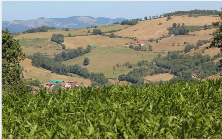
Vue du Crêt d'Arjoux (OTIMDL)