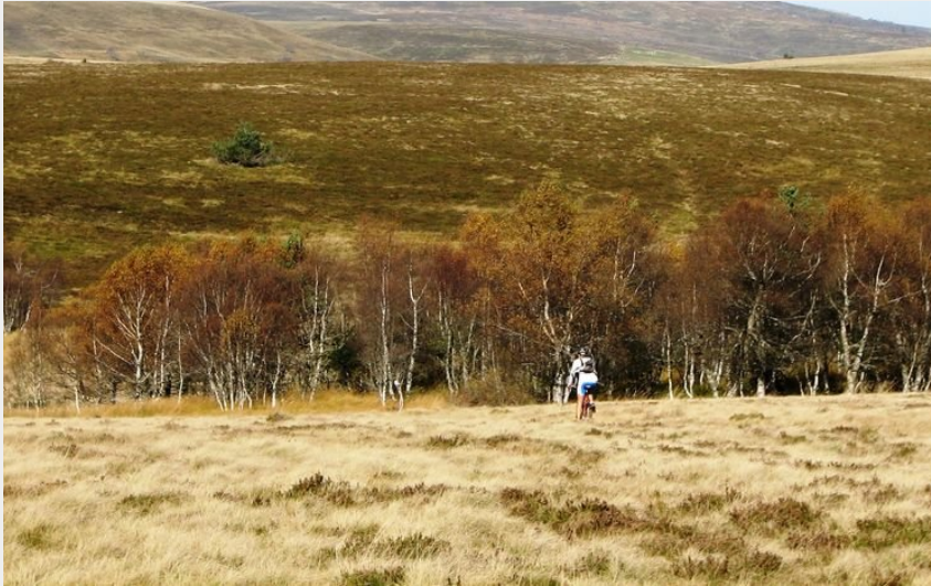
Les 7 vallées (Anne Massip©)