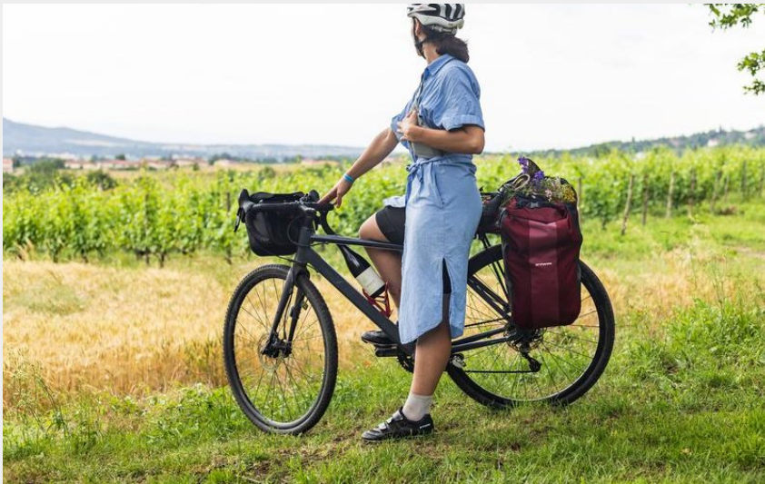
Mad-Jacques (Loire tourisme)