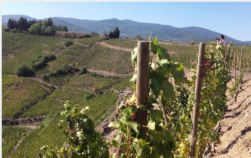
Vélo Pilat Rhodanien