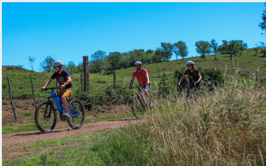
Circuit VTT Cordelle (Roannais Tourisme)