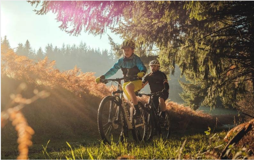
Balade en VTT à Villerest