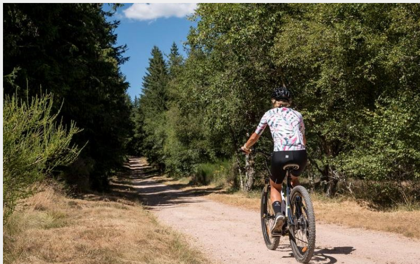
Balade en VTT à Renaison