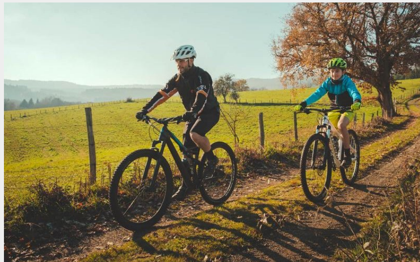
Balade en VTT à Montagny (Clovis Huet / RT)