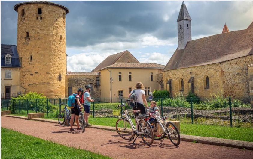
L'Abbaye bénédictine de Charlieu