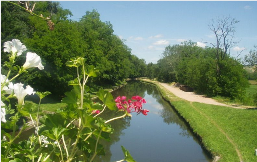
Briennon-Le Crozet