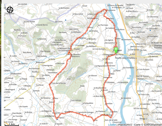
Départ de la boucle cyclo R2 le long du canal de Roanne à Digoin