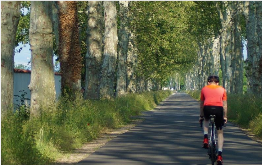
VTTiste (OT Forez Est)